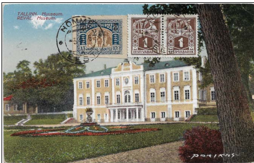
Afb.3a (82 %)

De laatste kaart (afb. 4) is een aangekende ansichtkaart. Aantekeningen van ansichtkaarten zien we niet zo vaak. De afbeelding is van de bekende toren 'Lange Herman' in Tallinn.