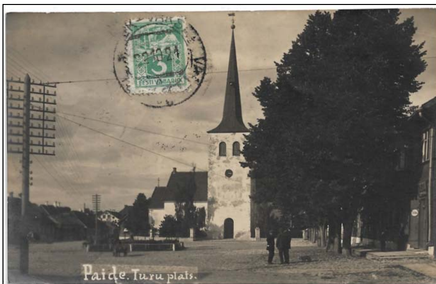
Afb. 2a (85 %) Ansichtkaart, verzonden naar België vanaf het stationspostkantoor van Valk, 22 10 24.