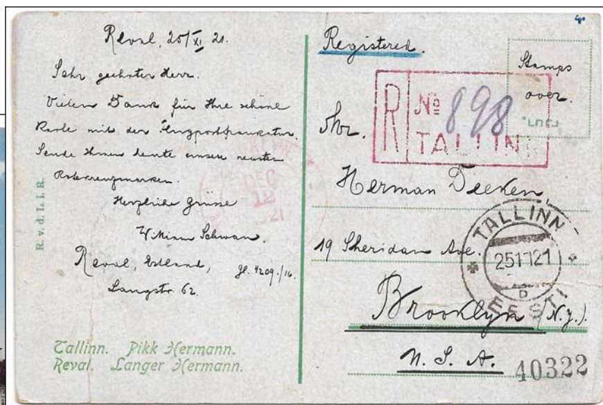
Afb.4 (82 %)

Ansichtkaart naar de Verenigde Staten, verzonden vanuit Tallinn, 25 11 21.