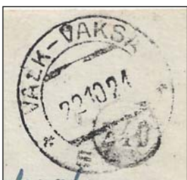
Afb. 2b (100 %)

De eerste ansichtkaart ( afb. 2 ) is bijzonder omdat het een oude fotokaart is: het opschrift is in het negatief ingekrast. De kaart is 'bildseitig' gefrankeerd en dit heeft het voordeel dat op de adreszijde –meestal- een duidelijk stempel staat.