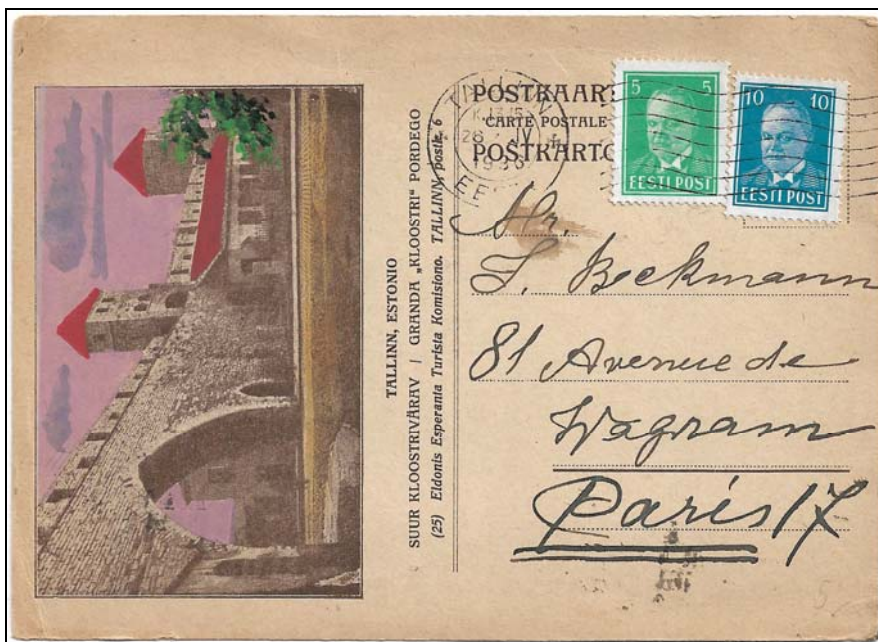
Afb. 1 (79 %) Een briefkaartformulier, verzonden vanuit Tallinn naar Parijs, 26 IV 1936.