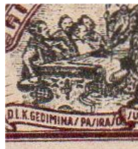
Detail afb. 3 Echt

Bij de valse zegel van afbeelding 9 zien we dezelfde kenmerken: het ‘watermerk’ deugt niet, de details zijn minder scherp/fout en de kleur is flets in vergelijking met de echte zegel ( afb. 3 ).