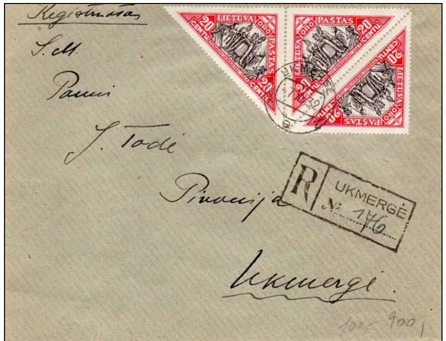
Afb. 7a Aangetekende brief binnen Ukmergė, -7 XII .32

Bij de terugdateerde stempels zijn hiervoor KLAIPEDA 2 en KLAIPEDA-PARODA genoemd. Dit laatste stempel is een gelegenheidsstempel, alleen gebruikt in de periode 10-17 juli 1927 en is dus altijd onjuist op de 7-dagen zegels.