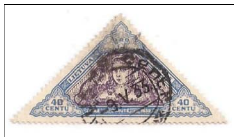
Afb. 6 (100 %) Mi. 352

Verder is een fout stempel Zarasai 26.6.33 bekend.