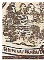
Detail afb. 9 Vals

Bij de valse zegel van afbeelding 9 is ook de tanding onjuist: tanding 13 in plaats van tanding 14 bij de echte zegels.