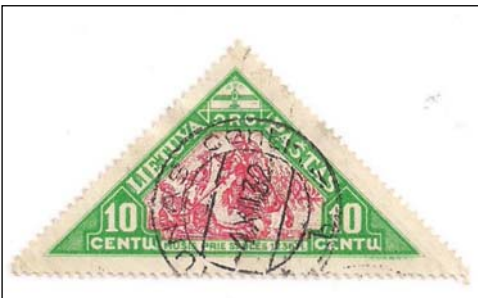
Afb. 5 (100 %) Mi. 341

De stempels van Kaunas centr. komen voor met meerdere kenletters.