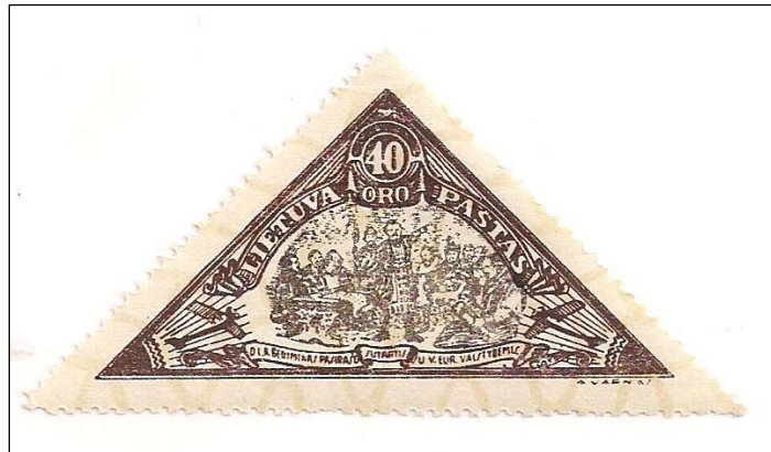
Afb. 9 (135 %) Mi. 344

Bij de valse zegel van afbeelding 9 zien we dezelfde kenmerken: het ‘watermerk’ deugt niet, de details zijn minder scherp/fout en de kleur is flets in vergelijking met de echte zegel ( afb. 3 ).