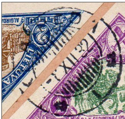
Afb. 3b (200 %)

Dit is een echt stempel en wordt ook in het handboek bij de echte stempels vermeld. De zegels op deze brief zijn van de 2 e uitgave, luchtpost, dus een dag te laat afgestempeld.