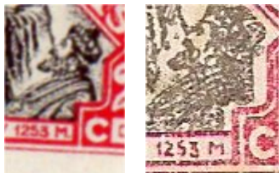
Detail afb. 7 Echt

Afbeelding 8 is wel heel duidelijk vals: op de voorzijde zijn de sporen te zien van de productie van het ‘watermerk’. Ook zijn details veel minder scherp dan de oorspronkelijke zegel.