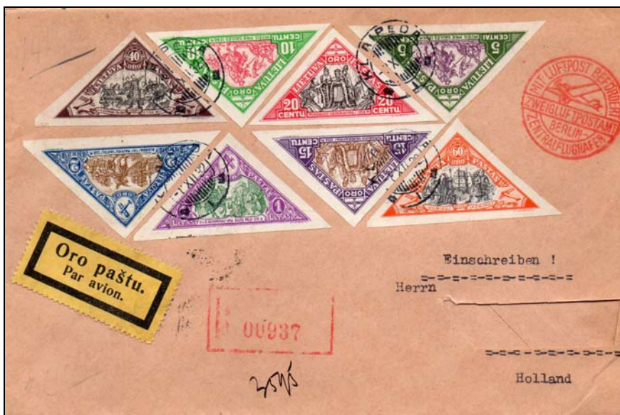
Afb. 3a Brief, verzonden per luchtpost vanuit Klaipėda naar Nederland, -8 XII 32. Wel maakwerk: de complete 2 e luchtpostserie is gebruikt voor de frankering.