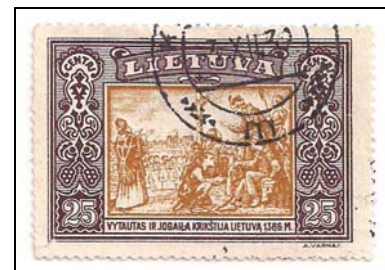
Afb. 4 (100 %) Mi. 335 met het stempel KLAIPEDA m -3. XII. 32. Stempel in gebruik 24.IX.32 - 19.III.35.

Een overzicht van de geldigheid en mogelijke juiste stempeldata: tabel 1 .