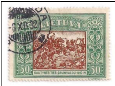
Afb. 4 (100 %) Mi. 336 met het stempel KLAIPEDA I -6. XII. 32. Stempel in gebruik ?..III.25 – 29.VIII.38.

Hieronder nog een zegel uit de 2 e Serie (afb. 4).