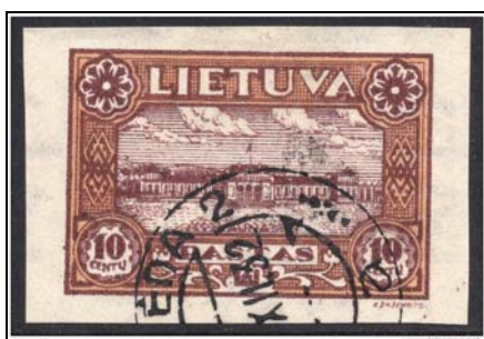
Afb. 1 Mi. 317

Het is duidelijk dat de zegels ongebruikt goed te vinden zijn, maar gebruikt heel lastig. De stempeldatum moet binnen de week van geldigheid vallen, maar dat is bij onderstaande zegel niet het geval ( afb. 1 ).