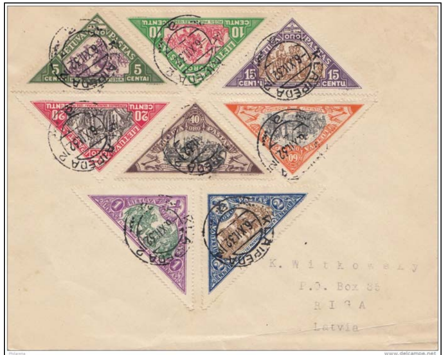
Afb. 2 (Met toestemming van de verkoper www.philartena.de ) Brief van Klaipėda naar Riga.

De postmeester-generaal sloot 6-5-1932 een akkoord met het kinderfonds: de drukkosten waren voor rekening van het kinderfonds ( lit. 1 ). Ook moest er 10.000 Litas aan de posterijen betaald worden. Het kinderfonds sloot weer een overeenkomst met Lissiuk, waarbij de kosten (drukkosten en 10.000 Litas)