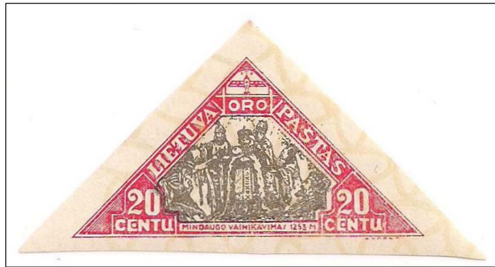
Afb. 8 (135 %) Mi. 343